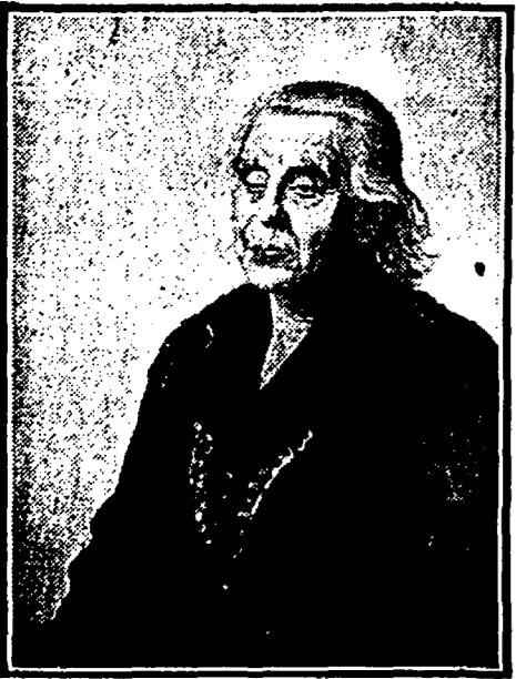
Kunst in de residentie. In Kunstzaal Nieuwenhuisen Segar wordt een aantal werken van Dirk Nijland tentoongesteld.