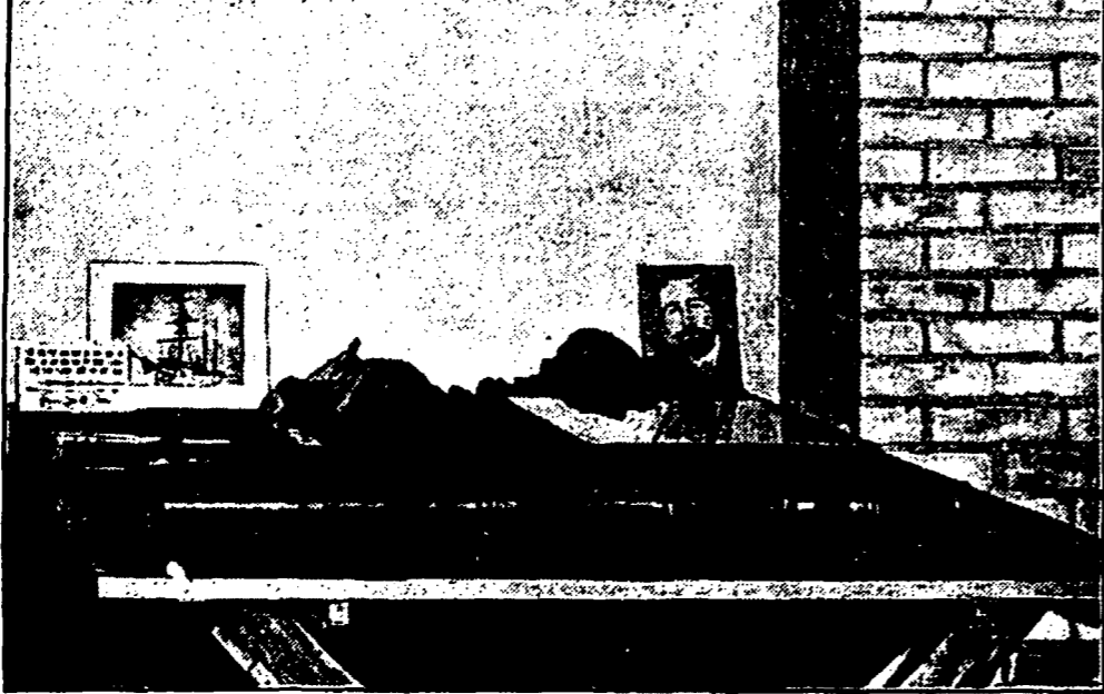
In het benedendaalfe worden zijn grafische werken geexposeerd. Links dan een vrouwepret, terwijl rechts een stilleven met Joseph Conrad staat afgebeld.