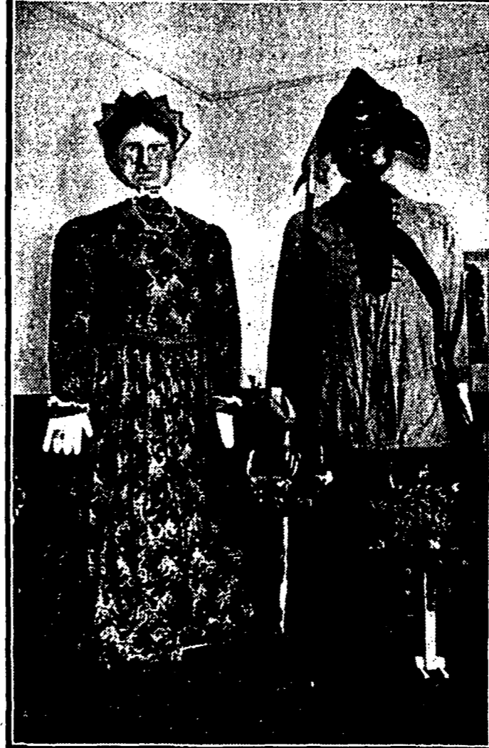
De reus Valuas en zijn huisvrouw, de stichters van de stad Venlo, die men thans in het gebouw van de Volksuniversiteit te Rotterdam kan gaan zien.