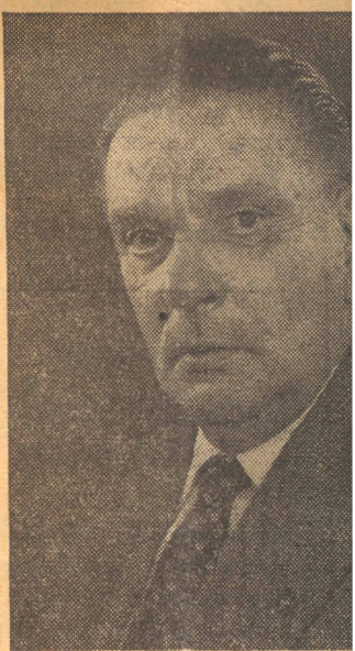
L. W. van der H

In 1960 ontving het bedrijf een belangrijke order voor de zend- en ontvangapparatuur ten behoeve van de door een aantal NAVO-landen in ge-