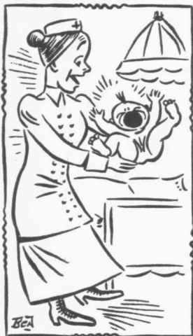
Warempel! 't Wordt de Directeur van Van der Heem N.V.