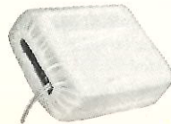
Het boventijkje is van helder wit linnen.