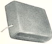
Het rubber kussen wordt omgeven door een ondertijkje.