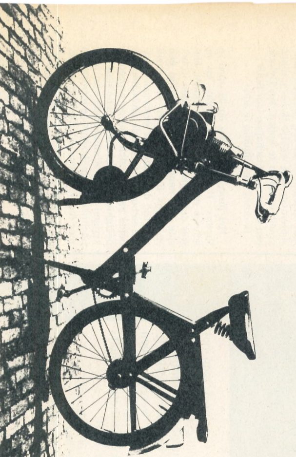
Uitgebreide informatie (ook over 'n zojuist uitgebracht model!) vindt u in folder 3800-1, die u kunt aanvragen bij Stokvis, groep Tweewielers, Postbus 426, Rotterdam.

Voor wie is deze brommer nu precies bedoeld? Voor mannen? Voor vrouwen? Voor de jeugd misschien? Ach wat. Hij wordt gemaakt voor mensen. Voor mensen die het zich kunnen veroorloven gewóón te doen. Daar zijn er toch nog meer van dan u denkt.