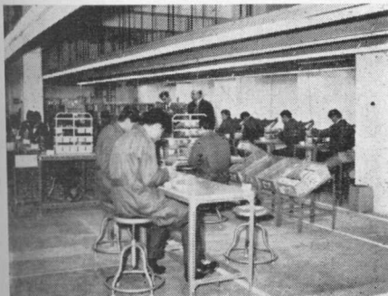
Overzicht van de montagezaal.