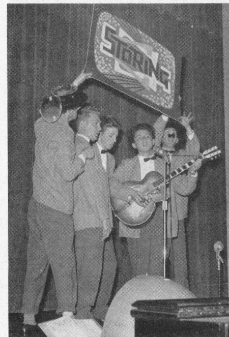
Een van de programmapunten van de laatste Bonte Avond.