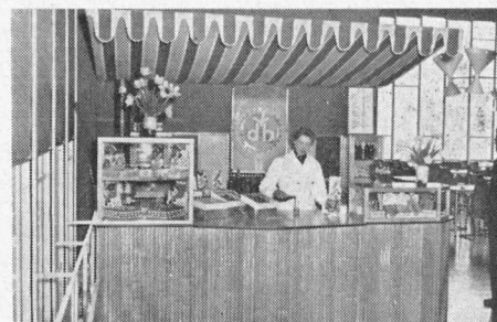
De eveneens in 1957 geopende versnaperingsbar heeft een ruime keuze versnaperingen, dranken en sigaretten.