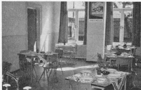
De kleine, maar gezellige kantine.

Op 28 augustus 1962 kon het gebouw opnieuw in gebruik genomen worden.