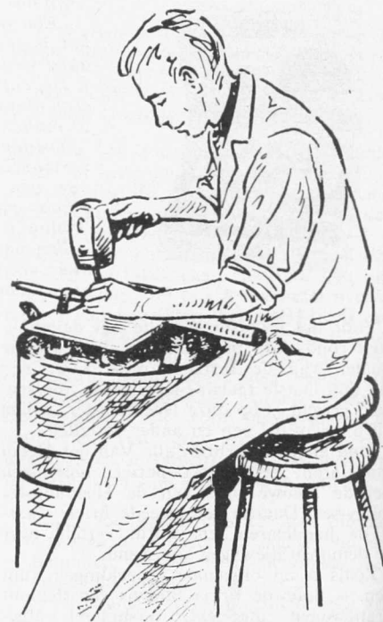
10. Het uit de hand kappen.

De kapper had de vijl voor zich op een aanbeeld geklemd met behulp van twee leren riemen (fig. 10). Bij het kappen had de beitel steun en richting van de vorige tand. Ervaren kappers bereikten snelheden van 80—200 slagen per minuut. Er was zeer veel ervaring nodig om de kap op de juiste hoogte en regelmatig te krijgen.