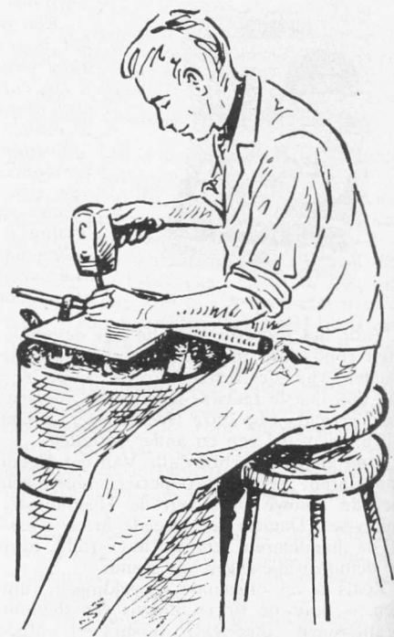
10. Het uit de hand kappen.

De kapper had de vijl voor zich op een aanbeeld geklemd met behulp van twee leren riemen (fig. 10). Bij het kappen had de beitel steun en richting van de vorige tand. Ervaren kappers bereikten snelheden van 80—200 slagen per minuut. Er was zeer veel ervaring nodig om de kap op de juiste hoogte en regelmatig te krijgen.