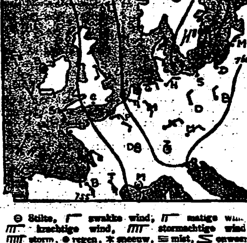
Barometer stationair of langzaam stijgend.

Verwachting: Zwakke tot matige. Oostelijke tot Zuidelijke wind, helder tot licht bewolkt, droog warm weer.